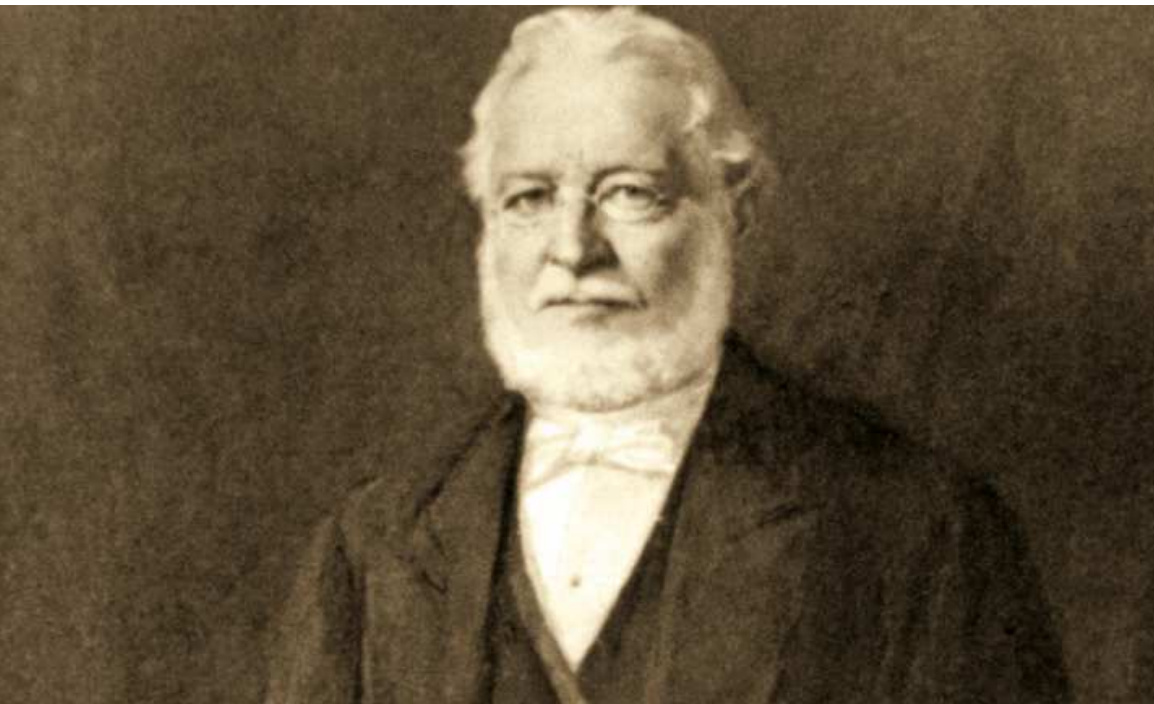
Ferdinand von Steinbeis (1807 – 1893)

Namensgeber der privaten Steinbeis-Hochschule ist Ferdinand von Steinbeis, der seiner Zeit weit voraus die Verknüpfung von theoretischem Wissen und praktischem Können in der Ausbildung junger Menschen anstrebte. Seine Arbeit und visionäre Kraft finden in den innovativen Studiengängen und Forschungen der Steinbeis-Organisation ihre Fortsetzung.