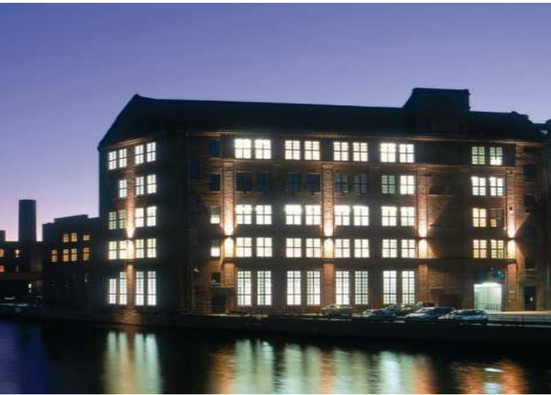
Sitz des IOM: Die Gebauer-Höfe in der Berliner Franklinstraße

Das Studienprogramm des IOM richtet sich an engagierte Nachwuchs- und Führungskräfte ,