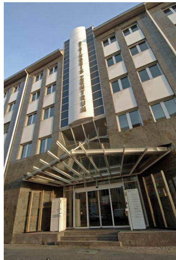
Das Steinbeis-Haus in Berlin