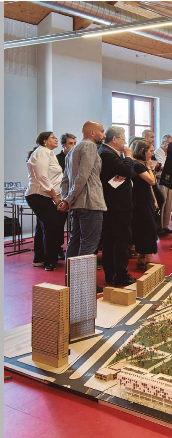
Exposición anual TFG. Ca l'Alíer, 2019.

Más información sobre becas y ayudas en: uic.es/becas